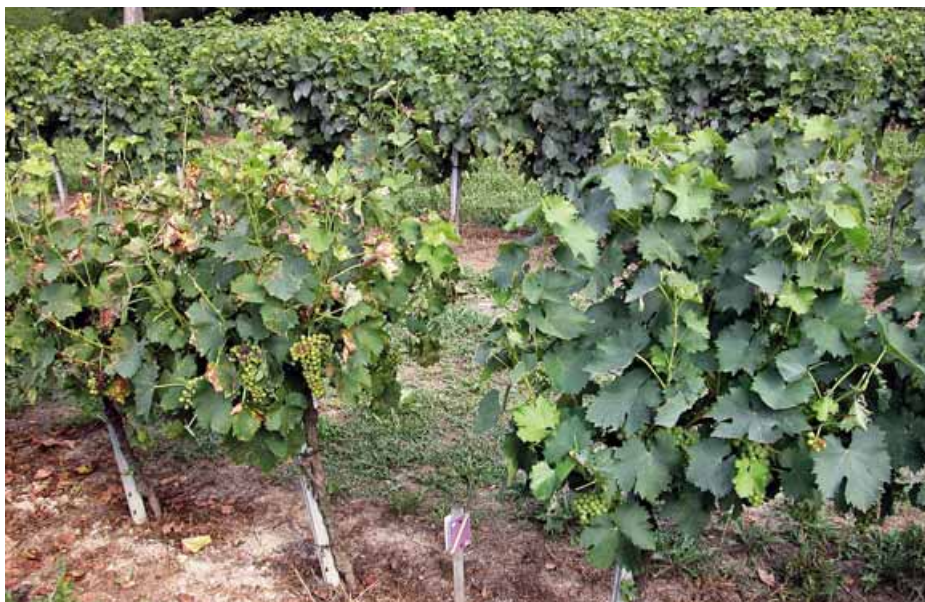
Foto 3 Evidente distacco fra la parcella testimone (a sinistra) e una trattata (a destra)

Quanto emerso non fa altro che confermare ulteriormente le poten-