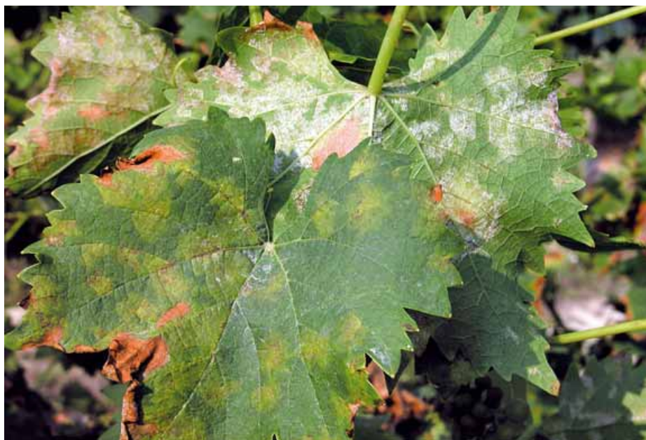
Foto 1 Foglie del testimone a metà luglio. Particolare della presenza di P. viticola su entrambe le pagine fogliari

LE PROVE avevano lo scopo di valutare la validità dei principali antiperonosporici appartenenti al gruppo dei CAA (dimetomorf, iprovalicarb, bentiavalicarb, mandipropamid e valifenalate) oggi in commercio nel controllare la peronospora della vite e se nel tempo, con l'insorgenza di possibili forme di resistenza di P. viticola , si sia ridotta l'efficacia. I risultati confermano la funzionalità di questi prodotti, anche con turni di applicazione mai inferiori ai 10 giorni.