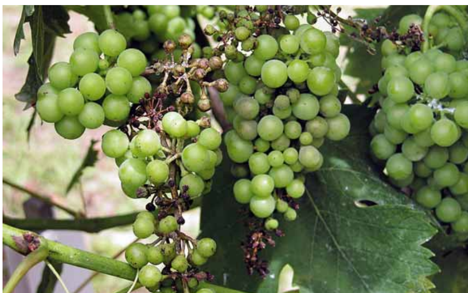
Foto 2 Peronospora larvata su grappolo a seguito di forte pressione infettiva