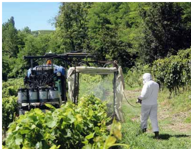
Foto A Prototipo ideato da VitEn per la distribuzione dei fitofarmaci in vigneti sperimentali

Il volume di irrorazione è stato di 750 L/ha.