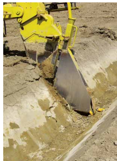
FOTO 6. SISTEMAZIONE DEI DRENAGGI IN TERRENI DI PIANURA

Riguardano una superficie vitata ridotta, perché solo una minima parte dei terreni vitati di pianura sono soggetti a ristagni idrici, per evitare