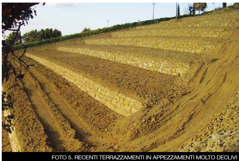
FOTO 5. RECENTI TERRAZZAMENTI IN APPEZZAMENTI MOLTO DECLIVI

Per ultimo accenniamo ai terrazzamenti (parliamo di grandi terrazzamenti con sbancamento e riporto a valle anche di diversi metri in altezza), fatti, si dice, essenzialmente per due motivi: ridurre i fenomeni erosivi e facilitare la meccanizzazione. Questi interventi ci lasciano perplessi, soprattutto quando si opera su pendenze non proibitive, che consentirebbero tranquillamente il transito in traverso con un modesto ciglionamento di ogni filare (magari con l'impiego di cingolati) perché tali interventi, che cambiano l'aspetto della pendice collinare, oltre a co-