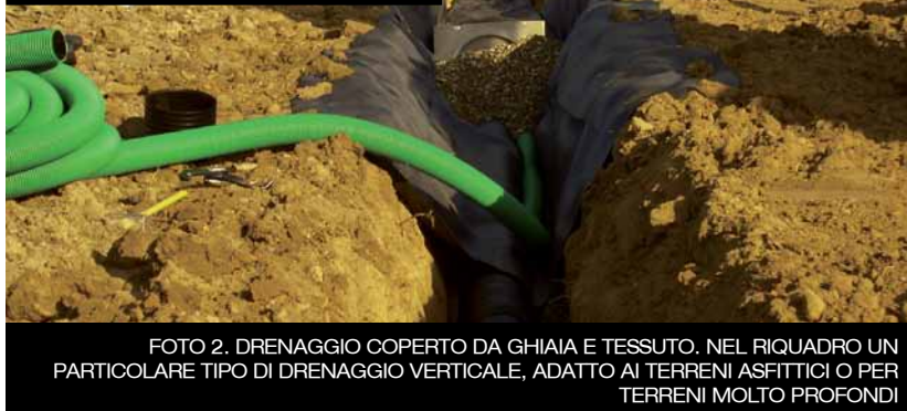
FOTO 2. DRENAGGIO COPERTO DA GHIAIA E TESSUTO. NEL RIQUADRO UN PARTICOLARE TIPO DI DRENAGGIO VERTICALE, ADATTO AI TERRENI ASFITTICI O PER TERRENI MOLTO PROFONDI