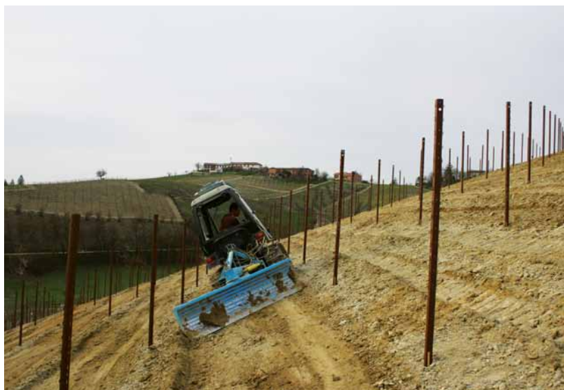
FOTO 4. CIGLIONATURA PER AGEVOLARE LA MECCANIZZAZIONE IN TERRENI COLLINARI. L'OPERAZIONE VIENE FATTA DOPO IL PIANTEMENTO DEI PALI, E PRIMA DELLA MESSA A DIMORA DELLE BARBATELLE

formare degli stretti ciglioni in corrispondenza della fila in modo da spianare i singoli filari. Per esperienza si è potuto constatare che è opportuno procedere al ciglionamento subito dopo aver impiantato i pali e prima di mettere a dimora le viti in modo da avere le altezze definitive del terreno e sistemare le barbatelle alla giusta profondità per evitare l'affrancamento (fig 4). Ovviamente con queste pendenze è impossibile l'impianto delle barbatelle a macchina.