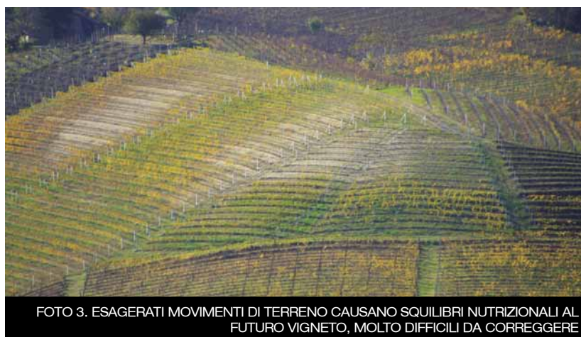
FOTO 3. ESAGERATI MOVIMENTI DI TERRENO CAUSANO SQUILIBRI NUTRIZIONALI AL FUTURO VIGNETO, MOLTO DIFFICILI DA CORREGGERE

In fase di reimpianto la prima operazione da effettuarsi, se necessario, è l'accorpamento degli appezzamenti, in quanto superfici polverizzate rendono veramente difficili, se non impossibili, gli interventi di livellamento. Anche gli accordi tra proprietari diversi (ad esempio procedere contemporaneamente all'estirpo e reimpianto) possono agevolare le operazioni di sistemazioni dei fianchi collinari. Quanto si può livellare? Tante sono le colline, altrettante le diverse possibilità di operare. La regola base, tecnica e allo stesso tempo economica, è quella di ridurre gli spostamenti di terreno al minimo indispensabile per consentire la meccanizzazione. Dal punto di vista estetico le colline sono belle anche se irregolari e scoscese, le modifiche dei livelli sono quindi volte esclusivamente a fini pratici. Gli spostamenti del ter-