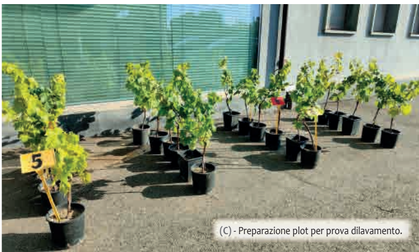
(C) - Preparazione plot per prova dilavamento.

alle pratiche agronomiche zonali. Con l'entrata in vigore del nuovo regolamento europeo in materia di fertilizzanti (Reg. UE 2019/1009), si è reso necessario testare l'efficacia dei prodotti biostimolanti. Per questo, Agrigeos ha deciso di dedicare un team di professionisti allo svolgimento di prove sperimentali per conto di importanti player del settore.