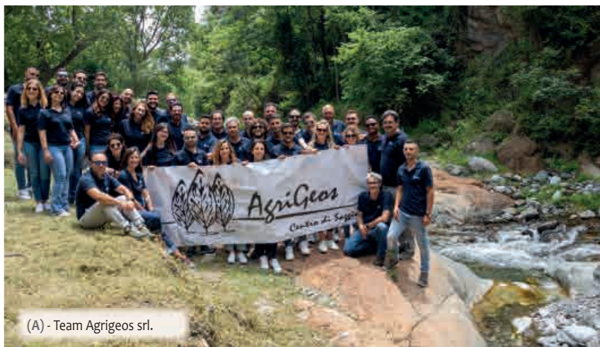
(A) - Team Agrigeos srl.

quale Agrigeos si è attestata come capofila in Italia nello sposare il progetto. Grazie a Plantarray System, Agrigeos conduce prove di fisiologia applicata in collaborazione con importanti player del settore agrochimico e con istituti di ricerca pubblici e privati.