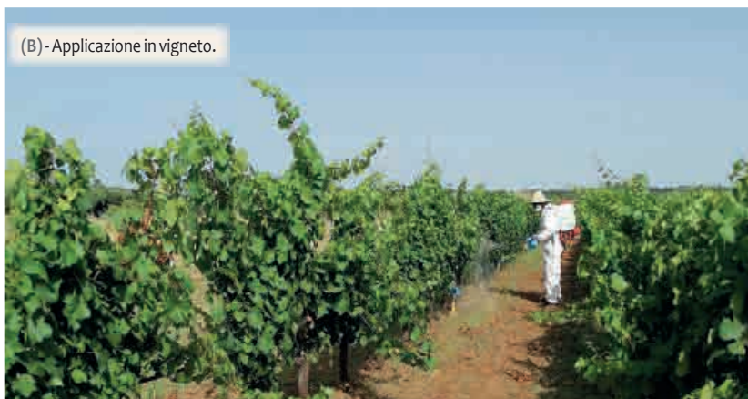
(B) - Applicazione in vigneto.

Le molteplici capacità professionali che caratterizzano il team, permettono di realizzare progetti di sperimenta-