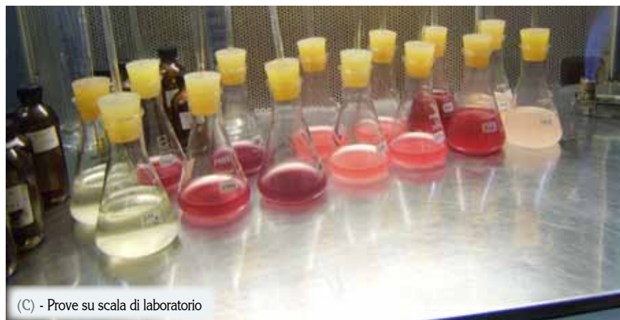
(C) - Prove su scala di laboratorio