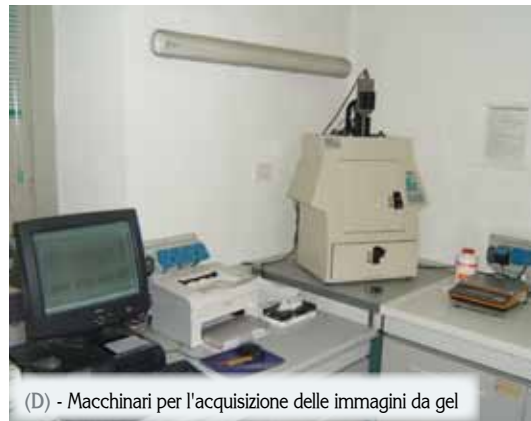
(D) - Macchinari per l'acquisizione delle immagini da gel

sima area viticola. Esiste, quindi, una distribuzione geografica dei ceppi di O. oeni che si sviluppano spontaneamente nel vino.