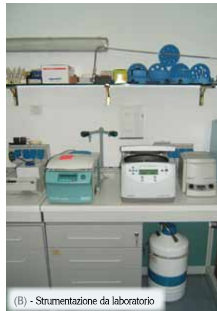
(B) - Strumentazione da laboratorio

certezza che i ceppi coinvolti saranno gli stessi nelle successive annate. Per tutti questi motivi è dagli anni '80 che sono in commercio colture selezionate di batteri lattici per la FML.